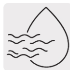
Aplicación húmedo y seco