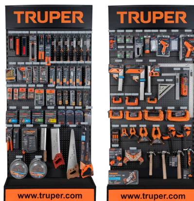
Planograma de carpintería