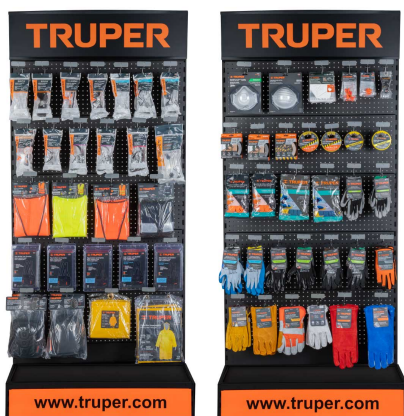
Planograma de seguridad industrial