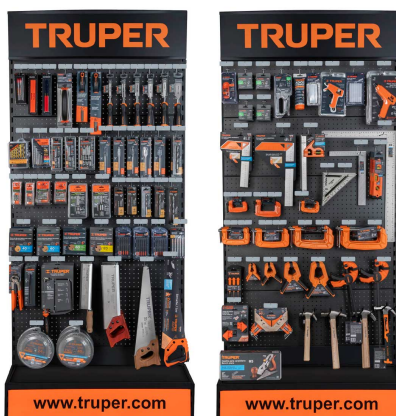
Planograma de carpintería