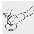
Mango lateral para mayor comodidad y control