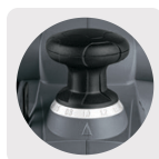
10 Niveles de profundidad