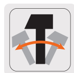
Cincel + ángulo ajustable