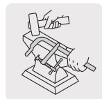
Forjadas en una sola pieza