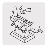
Forjadas en una sola pieza