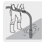
Para compactar el concreto