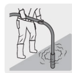
Para compactar el concreto