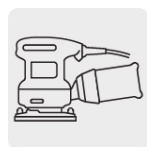
Para lijadora roto-orbital