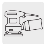
Para lijadora roto-orbital