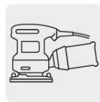
Para lijadora roto-orbital