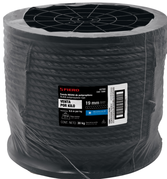
Fabricada en polipropileno

FIERO 40788 CUA-190K Cuerda NEGRA de polipropileno BLACK polypropylene rope VENTA POR KILO 19 mm Puntaje: 5.6 ni por kg CONEJOS CONT. NETO: 30 kg FICHA TÉCNICA