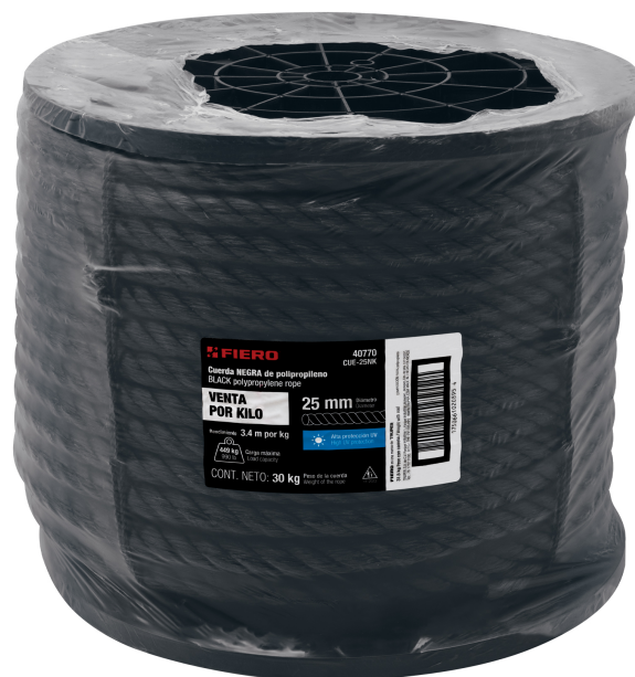
Fabricada en polipropileno