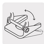
Zapata ajustable tipo pivote