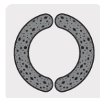
2 segmentos de diamante