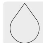
Para corte en húmedo