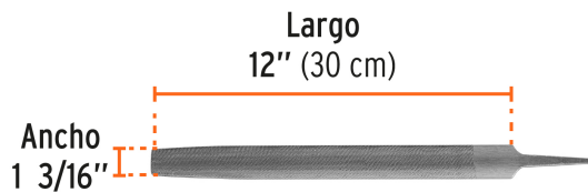
Picado doble para desbaste rápido