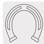
Escofina para herrar cascos de caballo