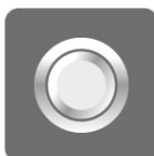
Ojillos de aluminio