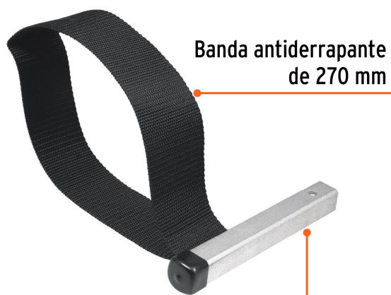
Banda antiderrapante de 270 mm