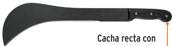
Cacha recta con remaches sólidos