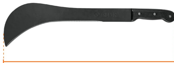
Largo total 21" (53 cm)