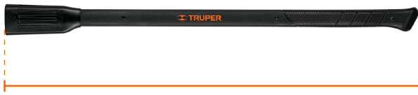
Largo 36" (90 cm)