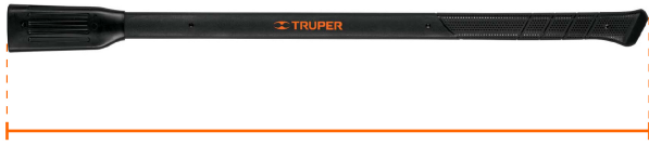
Largo 36" (90 cm)