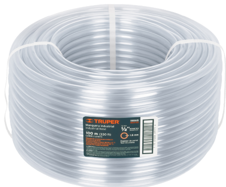
Rollo de manguera 100 m