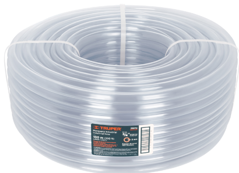
Rollo de manguera 100 m