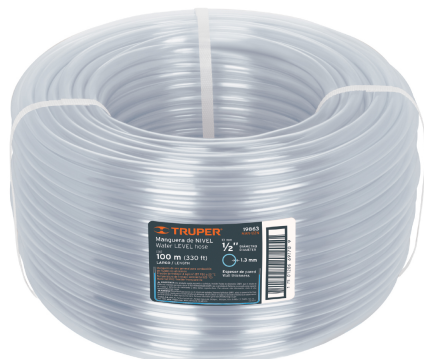
Rollo de manguera 100 m