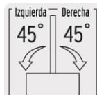
Guía soporte graduable