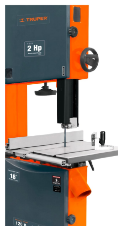
Guía de inglete