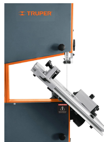
Inclinación de mesa -10° izquierda hasta 45° derecha