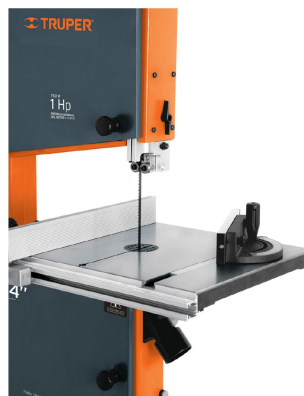
Guía de inglete