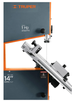
Inclinación de mesa 45°