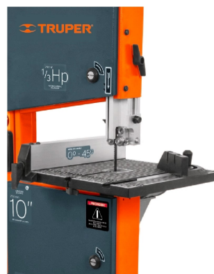
Guía de inglete