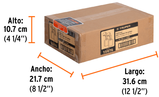
Contiene: 8 inner (96 piezas)