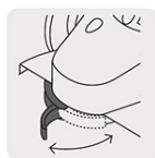
Guarda de ajustes rápido