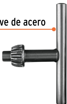
Llave de acero