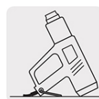
Soporte para trabajar a manos libres