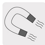
Porta puntas magnético