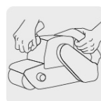
Operación a dos manos