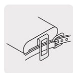
Clip para cinturón