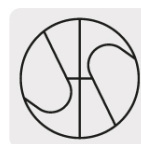
Punta Split Point