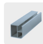
Metal no ferroso