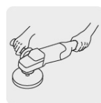
Mango lateral para mayor comodidad y control