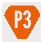
Zanco P3 antiderrapante