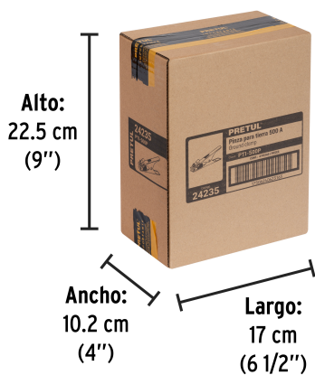
Alto: 22.5 cm (9")