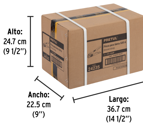
Alto: 24.7 cm (9 1/2")