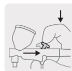
Control de aire y flujo de pintura