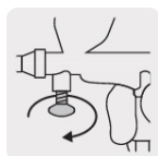
Válvula que regula la presión de aire