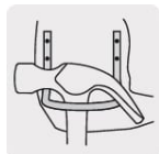
Gancho de acero para martillo