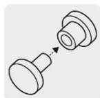
Cosido y remachado