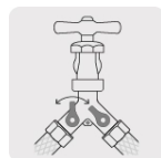
Válvulas de cierre de 1/4" de vuelta