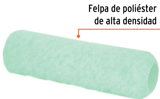
Felpa de poliéster de alta densidad