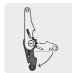
Mecanismo de liberación rápida