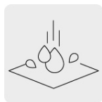
Resistente al agua