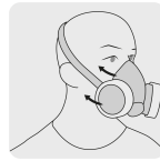
Arnés de banda elástica ajustable