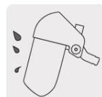
Protección contra impactos