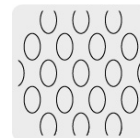
Malla al reverso