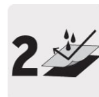
Capa de material PVC / Poliéster