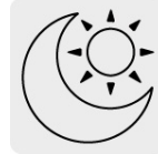
Uso de día y de noche