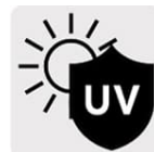
Resistente contra rayos UV