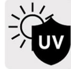
Resistente contra rayos UV