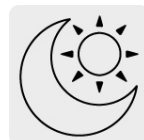
Uso de día y de noche